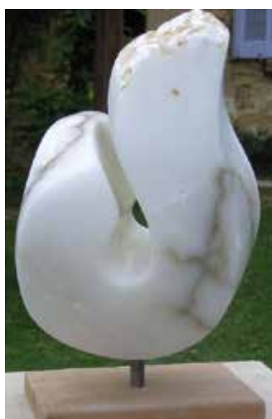
Ineke Wurf Bain