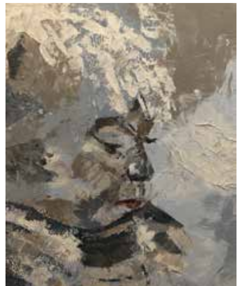
Marja de la Fosse